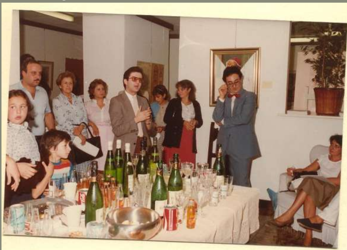
1983 inaugurazione mostra Galleria Temarte a Como