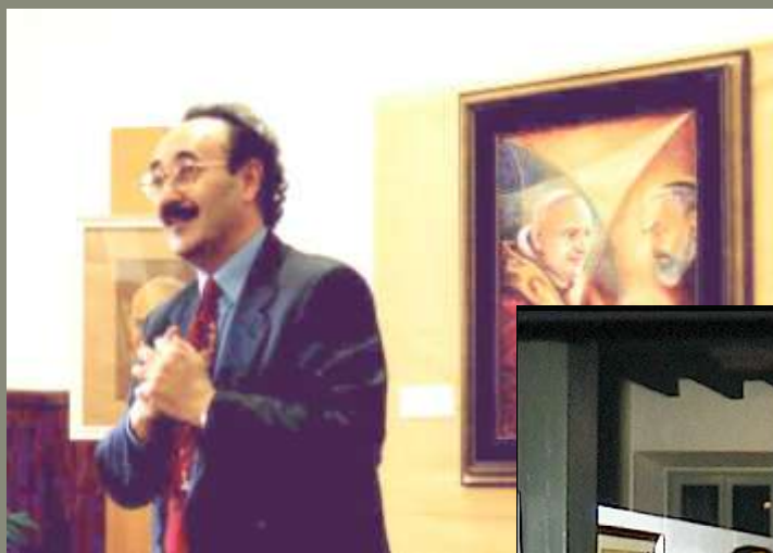
1999 Inaugurazione delle mostre su Padre Pio a Dongo e a Como