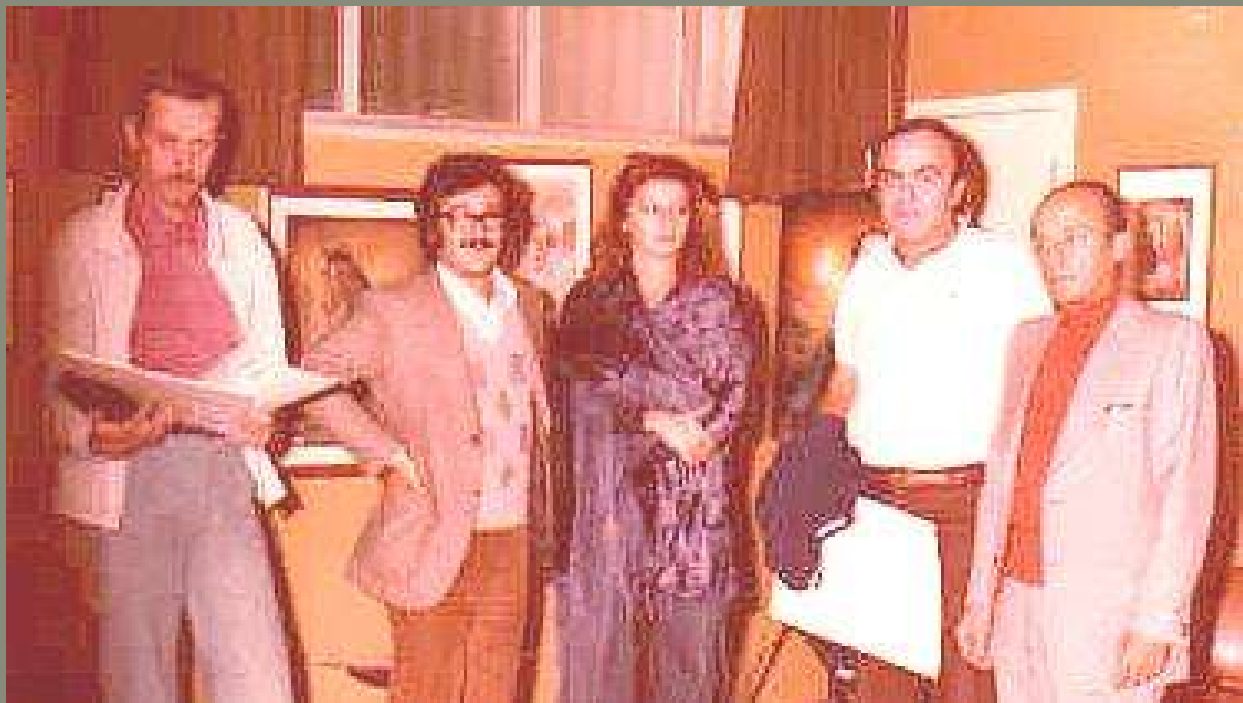
1974 - Mostra a Castrocarao