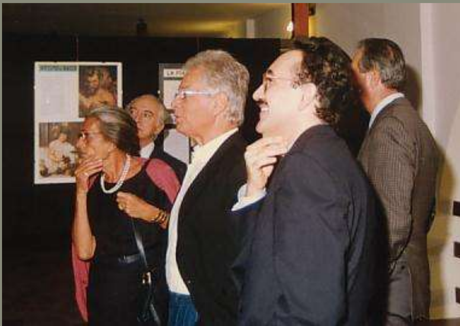
1991 inaugurazione della mostra i luoghi dell'Artusi a Bertinoro