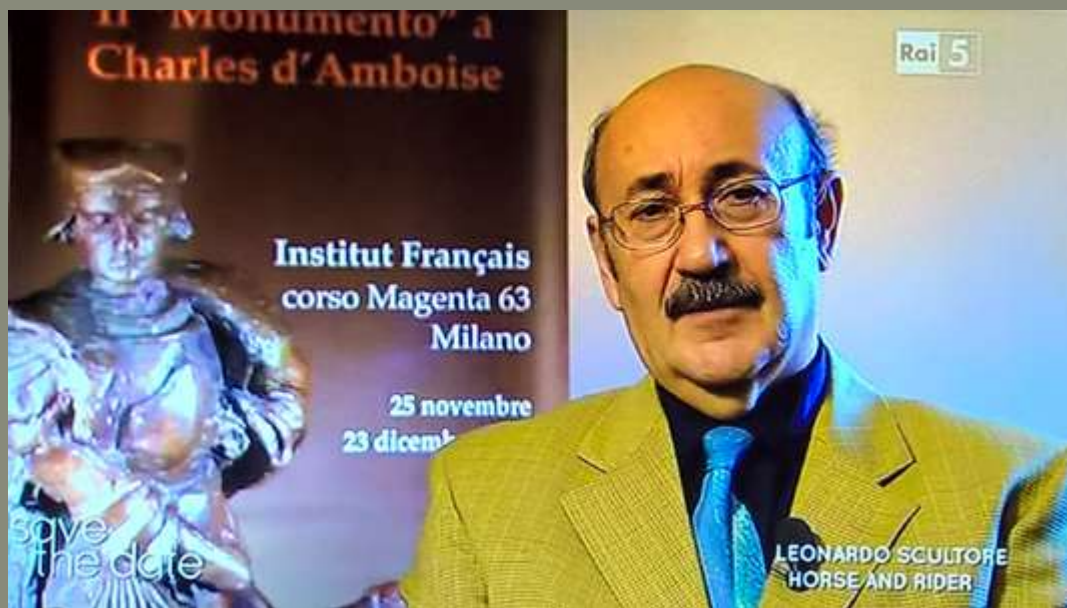
2016 Mostra a Milano Stelline: Horse and Rider Sotto: intervista di A. Angela ad Ulisse, Rai3