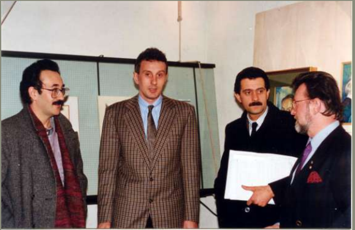
1988 Inaugurazione mostra "Comasco chi sei?" a Sant'Eufemia-Como