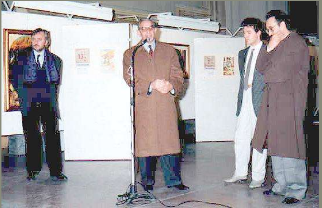
1989-inaugurazione mostra Leonardo e i Tarocchi, Como/San Francesco- 1994/95- inaugurazione mostra Federico II a Como