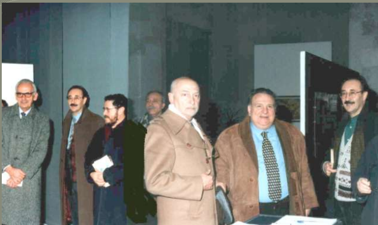
1999 Inaugurazione della mostra Infinito Leopardi a San Francesco