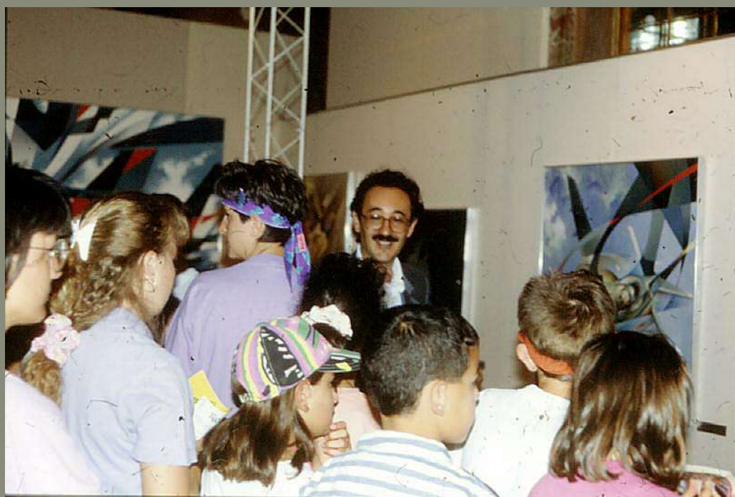
1990 Mostra di Villa Erba, "Il Cielo in mano"