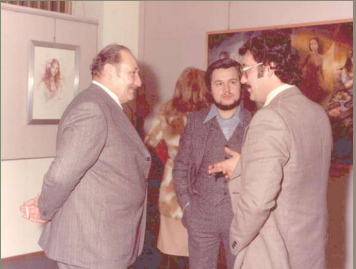
1977 inaugurazione mostra Galleria Francesca a Varese