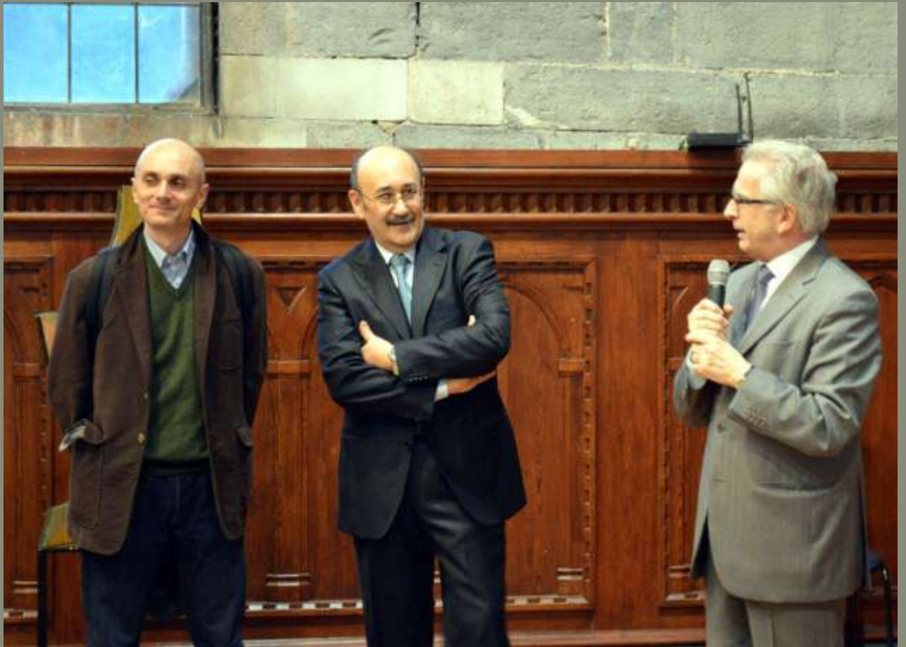
2014 Inaugurazione della mostra Antologica al Broletto di Como