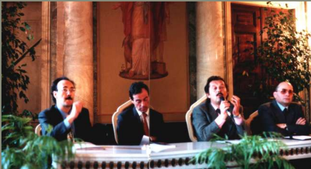
1997 Inaugurazione della mostra di Villa Olmo sull'Albero della vita